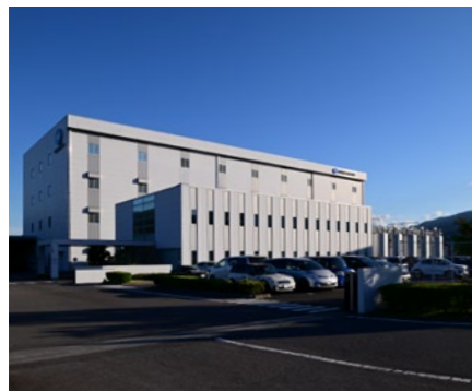
株式会社コニカミノルタサプライズ 辰野工場 長野県上伊那郡辰野町伊那富4333