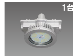
LED投光器 水銀ランプ400形相当 DTE13H21W/NPT-8 定格消費電力:96W