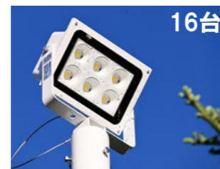
LED投光器 高圧ナトリウムランプ270形相当 定格消費電力:120W