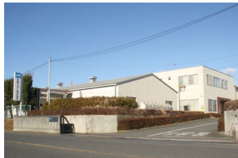
宇部フィルム株式会社 佐野工場 栃木県佐野市栄町1-3